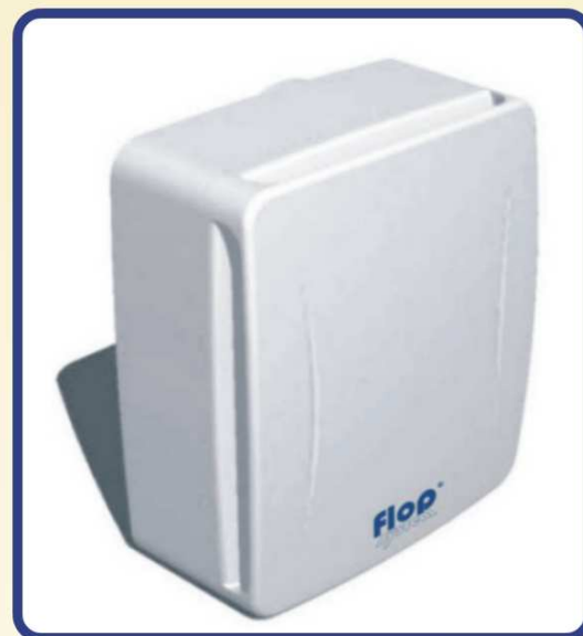
Widok wentylatora w rozłożeniu